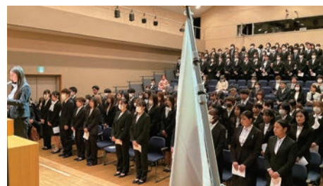
4月9日入学式の様子 (看護学科32名 介護福祉学科17名が入学しました)