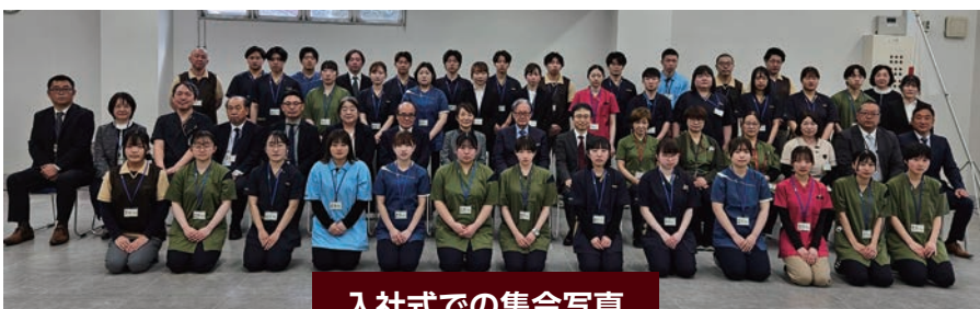
入社式での集合写真

新しい仲間を迎え、職員一同気持ちを新たに、より良い医療の提供に努めてまいります。