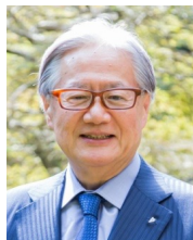
社会福祉法人 博友会 理事長